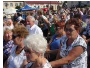
Wyjazd rekreacyjno-krajoznawczy Krajno - Bałtów 21.07.2017r