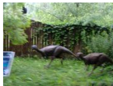
Wyjazd na musical „Skrzypek na dachu” kielecka Kadzielnia 9.09.2017r