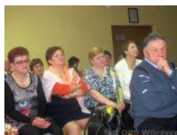
Zajęcia florystyczne Palma Wielkanocna 24.03.2017r